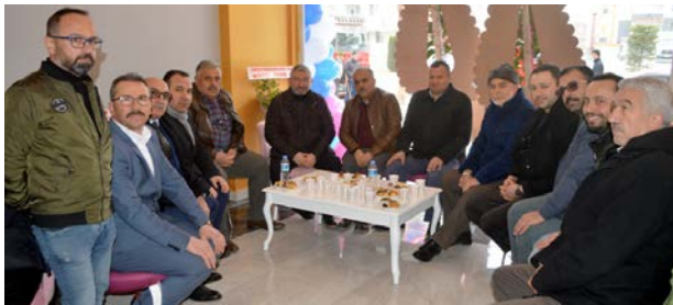
Açılışta çok sayıda davetli katıldı.