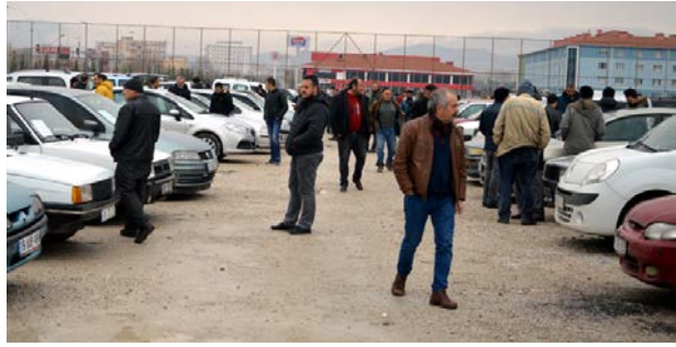
Çorum Açık Oto Pazarı, bu hafta da ikinci el satıcı ve alıcıları bir araya getirdi.

Yapılan yasal düzenlemelere rağmen bazı vatandaşların ısrarla yaya geçitleri dışında kalan alanlardan geçiş yapmaya çalıştıklarını anlatan sürücüler, can ve mal güvenliği hiçe sayarak kazalara davetive çıkaran tüven ve davranışlar sergileyenlere karşı da yasal yaptırımlar uygulanması gerektiğini ifade ettiler.