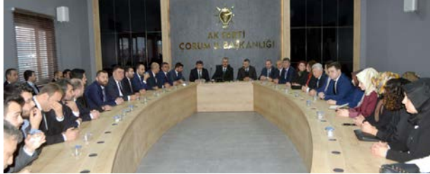
AK Parti'de yeni yönetim kurulu ilk toplantısını dün yaptı.

Ankara Yolu Üzeri 5. Km ÇORUM Tel: 0364 235 03 75