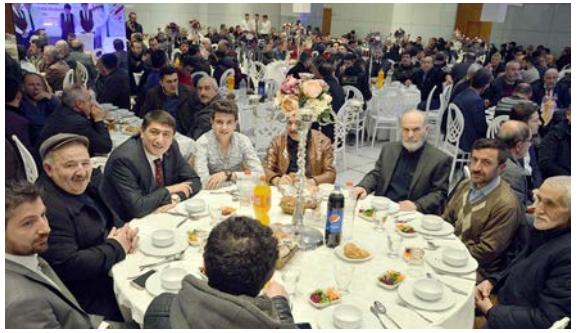
Program Kültür Balo Düğün Salonu'nda yapıldı.

Durumu başvuru şartlarına uyan ve program kapsamında çalışmak isteyen vatandaşlarımızın 15 Şubat 2019 Cuma gününe kadar (cuma dahil), İŞKUR İl Müdürlüğüne veya İlçe belediyeler bünyesinde faaliyet gösteren Hizmet Noktalarına şahsen gelecek ya da www.iskur.gov.tr internet adresinden saat 24.00'e kadar başvuruların alınacağını duyurdu. (Haber Merkezi)