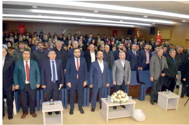
Mahalle Danışma Meclisi toplantısına katılım yüksek oldu.