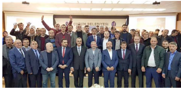
Toplantıda birlik ve beraberlik mesajları verildi.