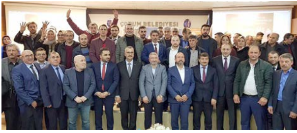
Toplantıda birlik ve beraberlik mesajları verildi.