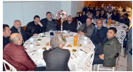
Programa katılım yüksek oldu.