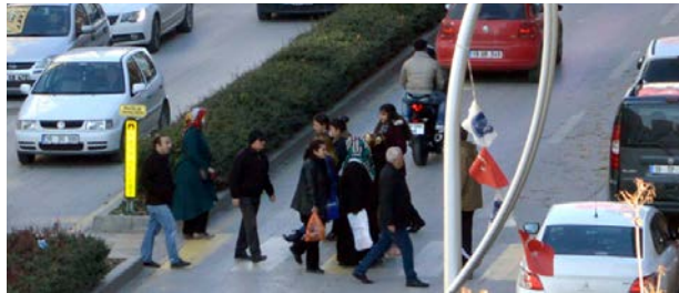
Çorumlu sürücüler, yaya geçitlerinde karşılaştıkları bazı sıkıntılardan dert yandılar.

Gazi ve İnönü Caddesi başta olmak üzere şehrin