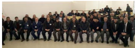
Afra Diğün Salonu'nda yapılan genel kurulda delegelerin tamamı oy kullandı.