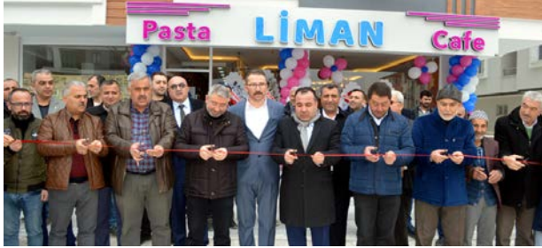
Yapılan duanın ardından açılış kurdelesi kesildi.