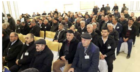
Çorum Ziraat Odası Başkanlığı Olağan Genel Kurulunda delegeler büyük ilgi gösterdi.