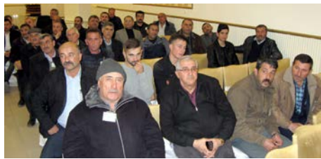
Büyük çekişmenin yaşandığı genel kurulda adaylar sırasıyla birer konuşma yaptılar.