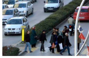
Çorumlu sınırcılar, yaya geçitlerinde karşılaştıkları bazı sıkıntılardan dert yandılar.

Sürücülerden yetkililere çağrı: 'Yaya geçitleri düzenlensin' *HABERİ 9'DA