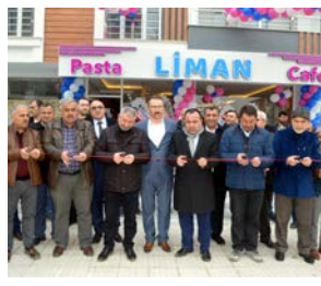
Yapılan duanın ardından açılış kurdelesi kesildi.