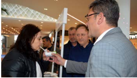
Programda karbonmonoksit ölçümü yapıldı.

Açılan stand da vatandaşlar, sigaranın zararları konusunda bilgilendirilirken aynı zamanda nefeste karbonmonoksit ölçümü yapıldı. Ziyaretçilere ayrıca sigara bırakma politikaları hakkında bilgi verildi ve sigaranın zararları konulu resim sergisi düzenlendi.