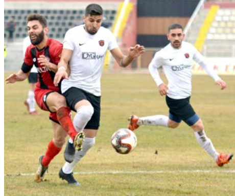
Mikail maçın ilk yarısında etkili oldu ancak ikinci yarıda fiziksel düşüş yaşadı