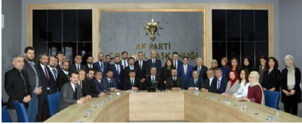
AK Parti'de yeni yönetim kurulu ilk toplantısını dün yaptı.