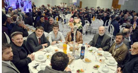
Program Kültür Balo Dügün Salonu'nda yapıldı.

■ Çorum Elektrik, Elektronik, Telefon, Beyaz Eşya Servisi ve Su Tesisatçıları Odası Başkanlığı tarafından birlik ve beraberlik gecesi düzenlendi. *HABERİ 10'DA