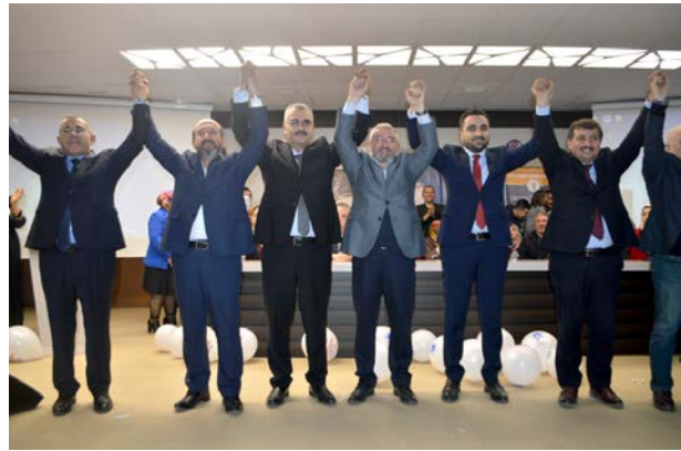
Belediye Konferans Salonunda yapılan Buharaevler