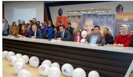
Toplantıda ilk olarak divan oluşturuldu.