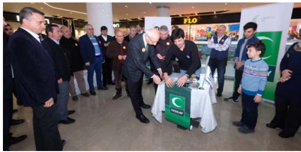
Yeşilay Çorum Şubesi AHL Park AVM'de farkındalık standı açtı.